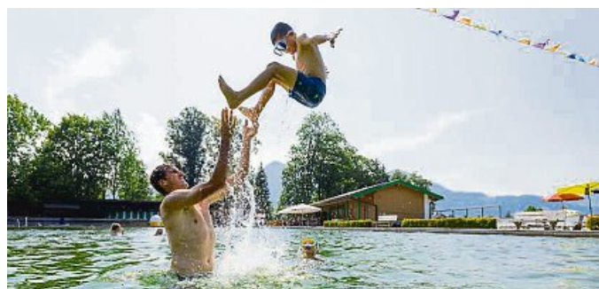
Im Freibad Lenggries ist die Saison eröffnet.

GEMA angemeldet und einen Lizenzvertrag geschlossen hat, muss nichts weiter unternehmen, wenn er die EM-Spiele seinen Gästen zeigen möchte. Wer jedoch mit der GEMA noch keinen Vertrag über eine Fernsehwerbung geschlossen hat und die EM-Spiele seinen Gästen zeigen möchte, muss zuvor eine Lizenz erwerben. Der Lizenzvertrag soll über das GEMA-Online-Portal vorgenommen werden: www.gema.de/portal .