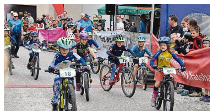
Auf die Plätze ... Start zum Isarcup in Hohenburg.

Sämtliche Termine der Isarwinkler Radsportport-