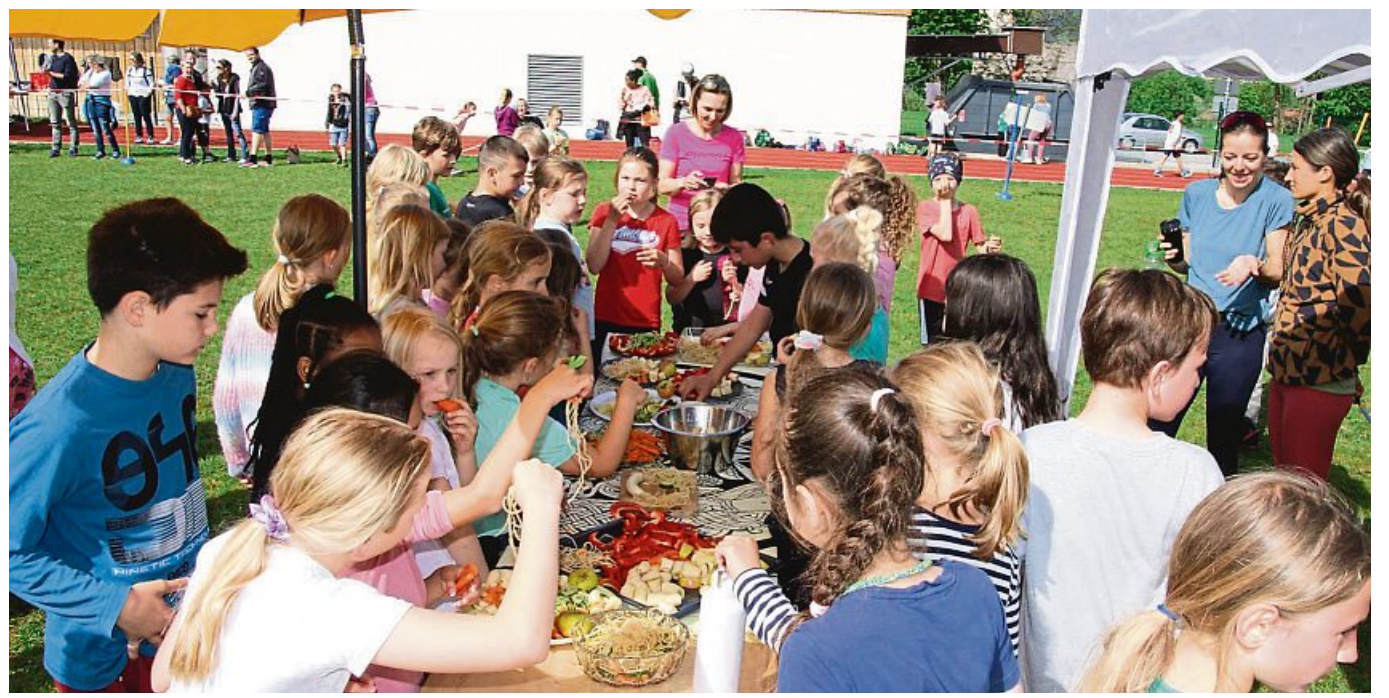
Begehrte Anlaufstelle: Die Obst- und Gemüsebar mit vielen frischen Früchten sowie Karotten und Gurkenschlangen.

Als absoluter Hit haben sich laut Schulleitung die Karotten- und Gurkenschlangen herausgestellt, die mit Hilfe eines Spiralschneiders gezaubert wurden. Die ganze Zeit herrschte eine tolle Stimmung auf dem Sportplatz, und es war schön zu sehen, wie freudvoll die Kinder das Angebot angenommen haben.