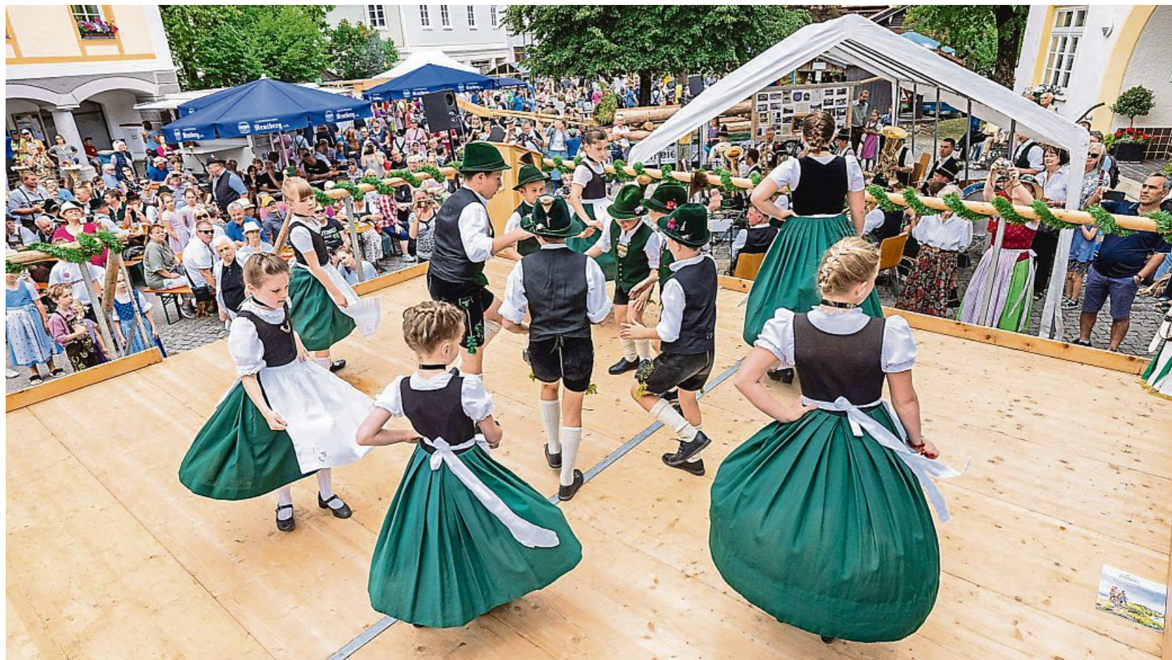
Die Jugendgruppen der Lenggrieser Trachtenvereine zeigen beim SommerFlimmern ihr Können auf der Bühne.