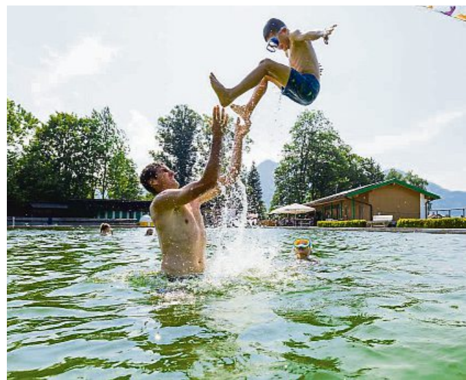
Abtauchen im Naturbad: Das Freibad Lenggries wird heuer 90 Jahre alt.

Bereits zwei Wochen später am Samstag, 29. Juni, findet das erste Open-Air-Konzert im Freibad statt. Sepp Kloiber und Martin Regnat, bekannt für ihre Virtuosität