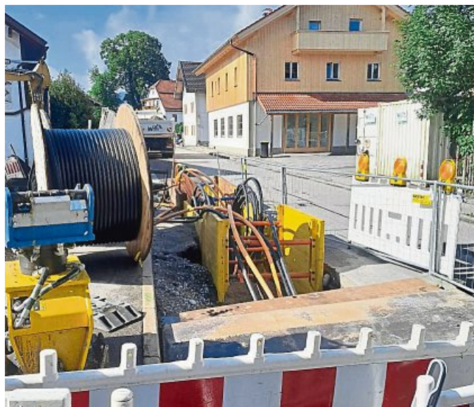
Die Karwendelstraße ist wegen der Bauarbeiten gesperrt. LN

Die Gemeinde bedankt sich nochmals bei allen für ihr Verständnis und hofft auf einen reibungslosen Bauablauf.