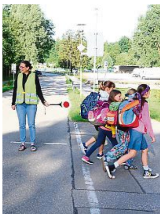
Verkehrshelfer sichern den Schulweg der Kinder.

LN. In Bayern sorgen knapp 25 000 Jugendliche und Erwachsene für die sichere Überquerung von Straßen für Kinder dem Weg zur und von der Schule. Dass sich in den letzten Jahren kein schwerer oder sogar tödlicher Verkehrsunfall an gesicherten Überwegen in Bayern ereignet hat, ist der Tätigkeit der Verkehrshelfer zu verdanken. Auch im Lenggrieser Gemeindegebiet soll nun ein solcher Dienst eingeführt werden. Am ehemaligen Feuerwehrhaus Anger wünschen sich einige Eltern Verkehrs-