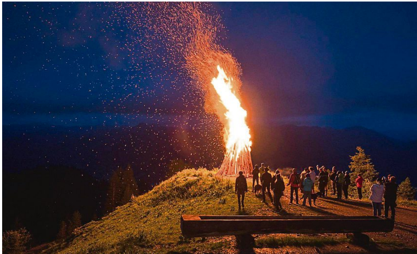
Berge in Flammen: Am Samstag, 22. Juni, findet eine Sommwendfeier mit Bergfeuer am Brauneck statt.

Donnerstag 20.06.2024 08:30 Uhr: Gästewanderung zur Schwaigeralm in Gaißbach. Gesamtgehzeit: 6 Stunden, Höhenmeter: ca. 700 m, Schwierigkeitsgrad: blau (Weg mit durchgehender Trasse und ausgeglichenen Steigungen; Bergwege sind markiert; Gelände teilweise steil, etwas Trittsicherheit) Unkostenbeitrag: mit Lenggrieser Gästekarte kostenlos, ohne Gästekarte Erw. 5 Euro, Ki. 2 Euro.