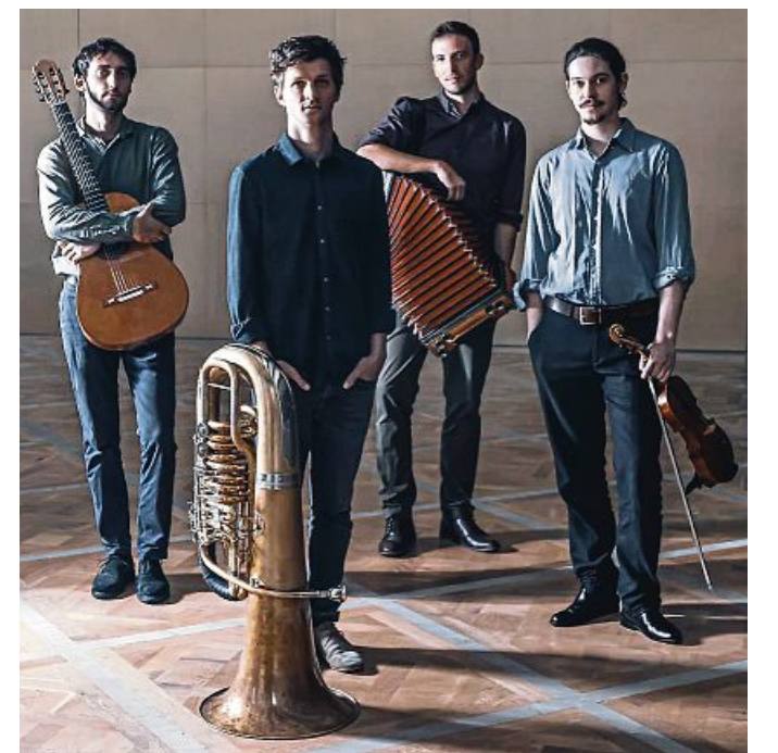
Newcomer: Die Gruppe Maxjoseph stellt am 19. Juli ihr neues Album „Tabularasa“ vor.

und Vielseitigkeit an Gitarre und Zisch, bieten eine musikalische Reise zu Johann mit Eigenkompositionen und Stücken anderer Künstler dar. Einlass ist ab 19.30 Uhr, Beginn um 20 Uhr. Der Eintritt ist frei.