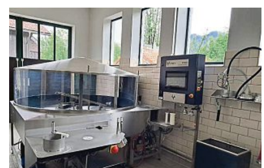
Die neue Schlauchpflegeanlage ist in Betrieb.

Die vollautomatische Anlage führt alle Schlauchpflegefunktionen vom Vorweichen über das Abwickeln, das Waschen, das Einschleppen, das Auslegen, das Fluten, das Druckprüfen, das Rauszie-