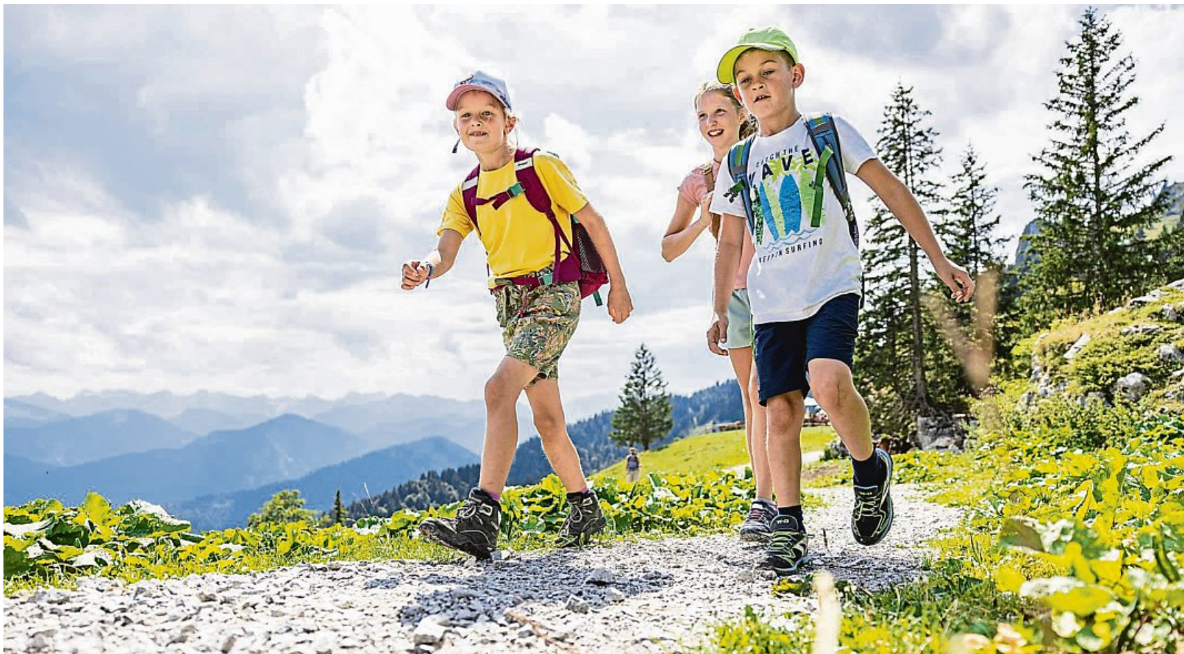
Unterwegs in den Bergen: Gästekinder bei einer altersgerechten Wanderung im Isarwinkel.

Das Programm ist in der Tourist-Information oder auf www.lenggries.de erhältlich.