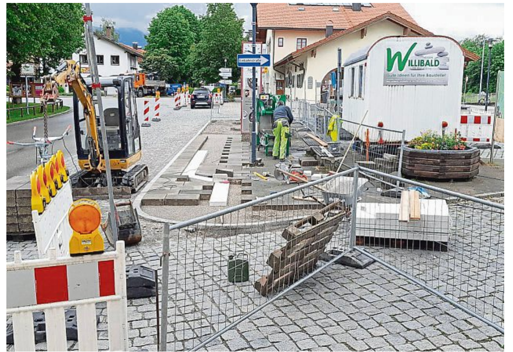
Die Bushaltestelle am Lenggrieser Bahnhof ist demnächst barrierefrei.

Projektleiterin Ruth Busl: Besuchen Sie unsere Webseiten und melden Sie sich an – in unserem vielfältigen Angebot ist sicher etwas Passendes für Sie dabei! Wir freuen uns auf Ihre Teilnahme und Ihr Engagement: zukunftehrenamt.info und kbw-toelz-wor.de oder rufen Sie uns an: 0 81 79/42 39 89-0.