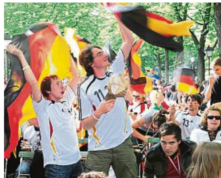
Fans feiern beim Public Viewing.

Am 14. Juni startet die Fußball-Europameisterschaft mit dem Eröffnungsspiel Deutschland gegen Schottland in München. Da die Finale am 14. Juli in Berlin. Wer ein öffentliches Public Viewing (zum Beispiel in Restaurants, Hotels, Lokalen oder sonstigen Betrieben) anbieten möchte, muss jedoch die GEMA beachten. Um die EM-Spiele öffentlich zu zeigen, muss daher zuvor eine GEMA-Lizenz eingeholt werden. Wer bereits einen Fernseher bzw. Bildschirm zur TV-Wiedergabe bei der