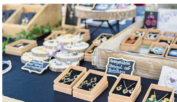
Schmuck aus der Region gibt es beim SommerFlimmern.

Der Wirtschaftsbeirat, das Beratungsgremium mit Vertretern von Vereinen, Wirtschaftsverbänden und Gemeinderatsreferenten, hat dem Gemeinderat vorgeschlagen, beim neuen Konzept für den Markt auf Qualität, Regionales und Handgemachtes zu setzen. Dieses Konzept wurde in der jüngsten Gemeinderatssitzung beschlossen. Durch das große